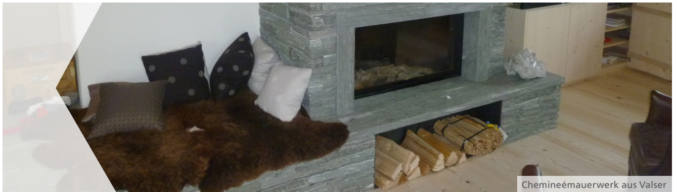
Chemineemauerwerk aus Valsertal